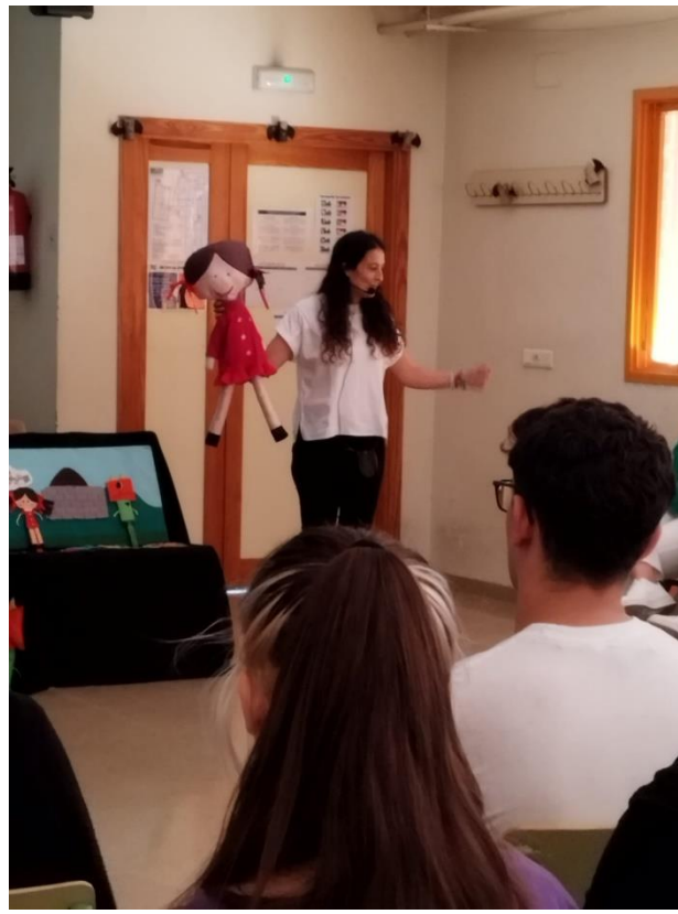
Charla-taller en el Ciclo Superior de Educación Infantil

Este proyecto está dirigido a todos los grupos del Centro y, más en general, a toda la comunidad educativa de nuestro Centro.